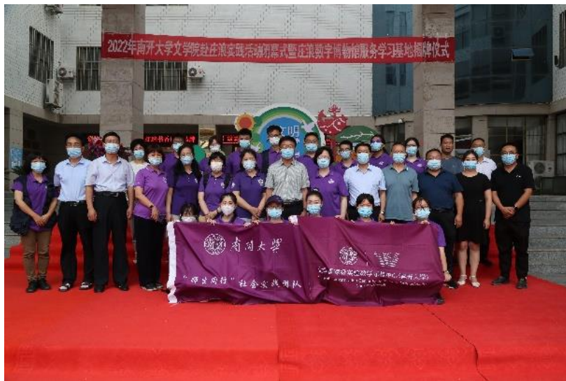
“南开大学庄浪数字博物馆服务学习基地”落成仪式