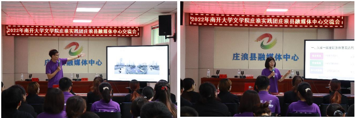
庄浪县融媒体中心活动现场