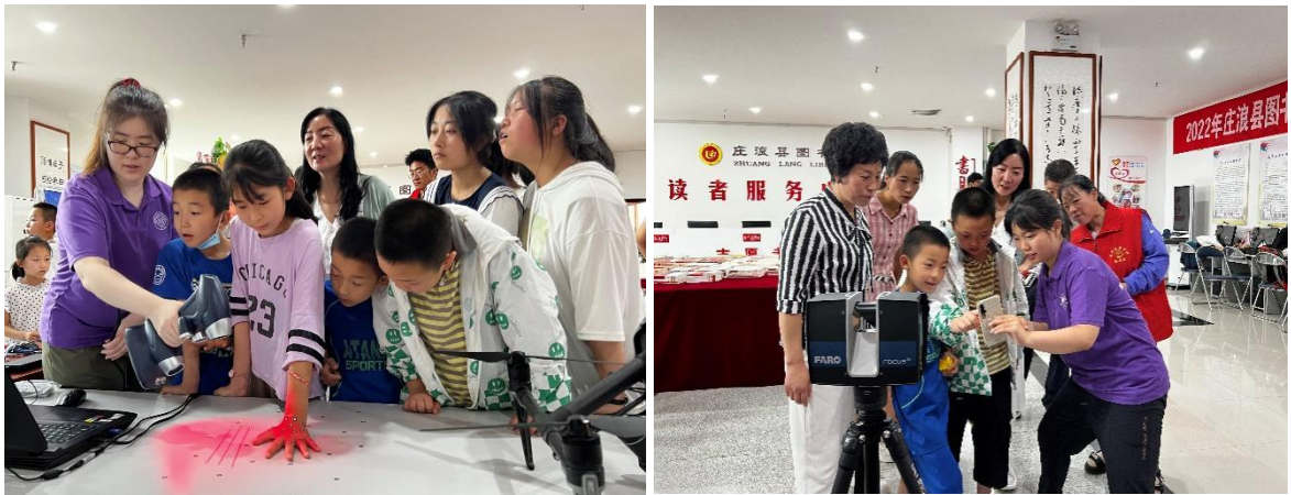
庄浪小朋友们正在体验 3D 扫描设施